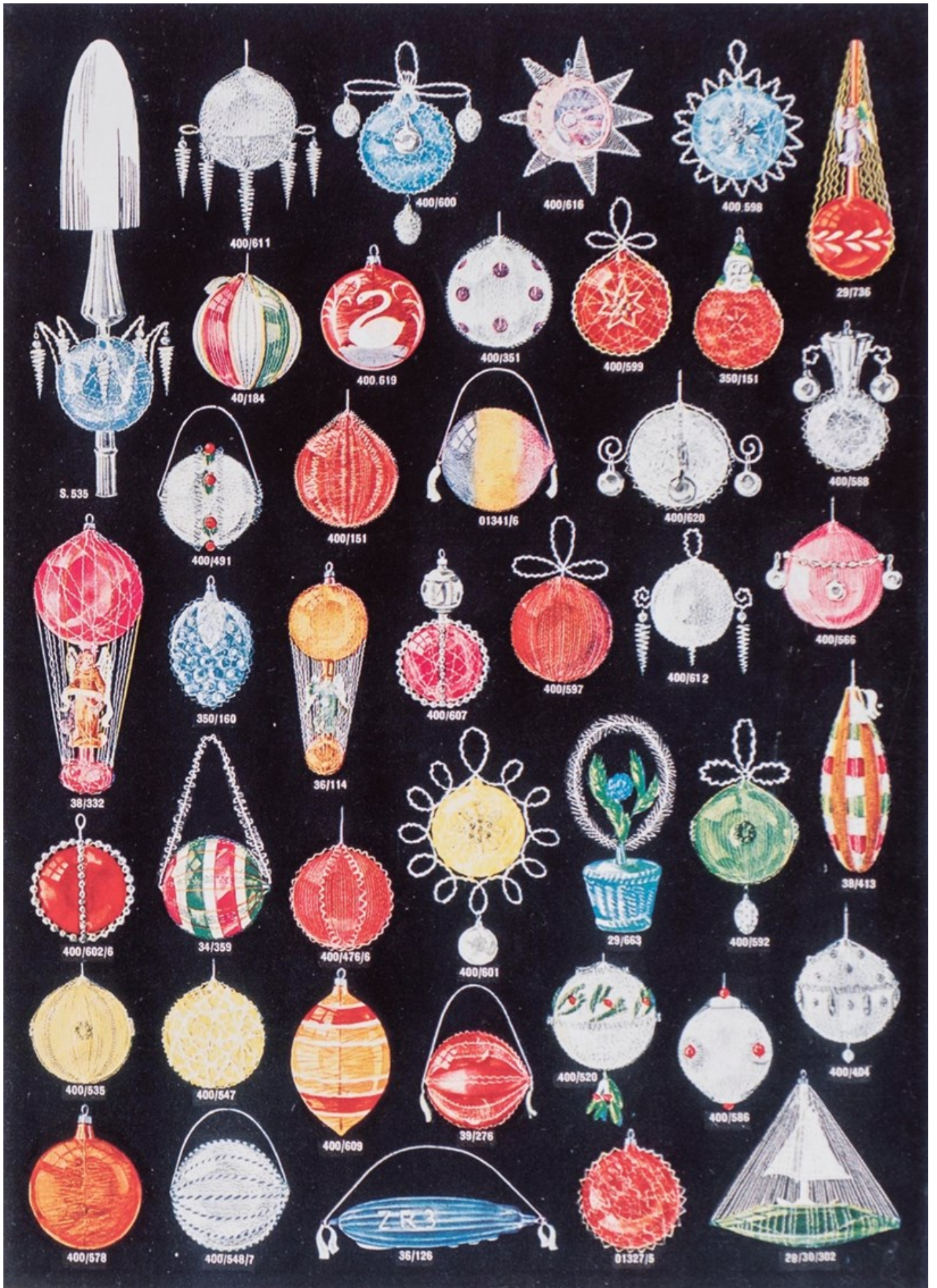
Katalog: Christbaum-schmuck Kühnert & Co. Berlin ca.1920