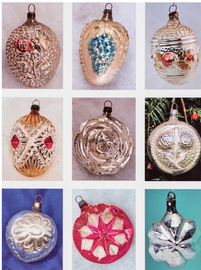
Kugler i alle former Lauscha 1910-1940