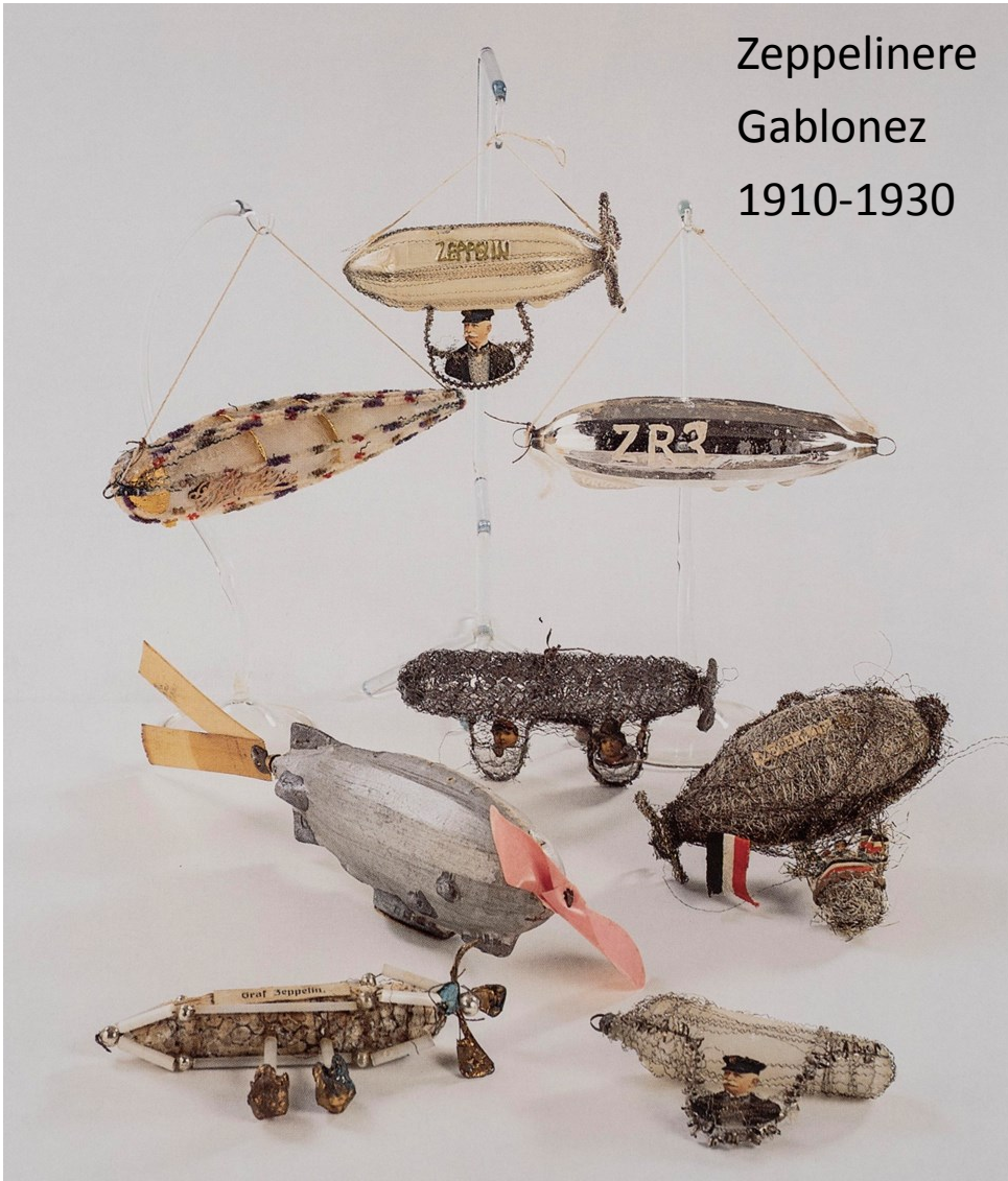
Zeppelinere Gablonez 1910-1930