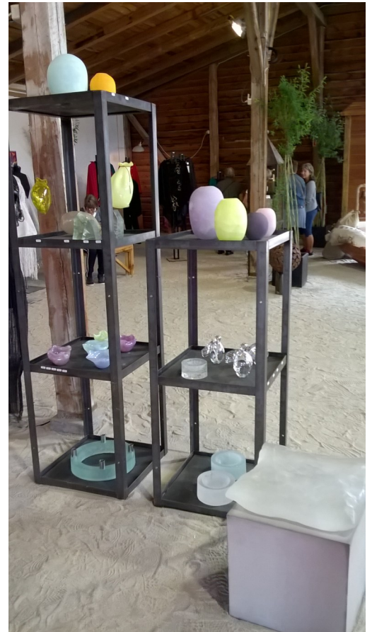
Lidt FOTO fra udstillingen i det Det Røde Pakhus Hobro tirsdag den 14.08.18 P. Schjelder